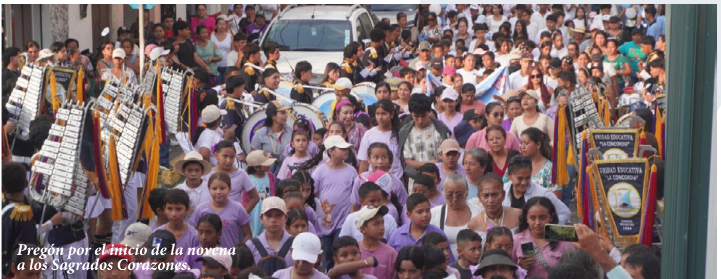
Pregón por el inicio de la novena a los Sagrados Corazones.