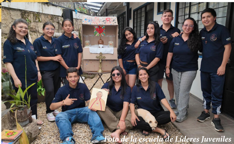
Foto de la escuela de Líderes Juveniles

A este esfuerzo se suma el apoyo que periódicamente brindan los jóvenes de El Porvenir, fortaleciendo la dimensión misionera de la pastoral juvenil. Entre los desafíos que se plantean para el futuro se encuentra la búsqueda y formación de nuevos agentes que puedan asumir de manera más estable el acompañamiento de este grupo.