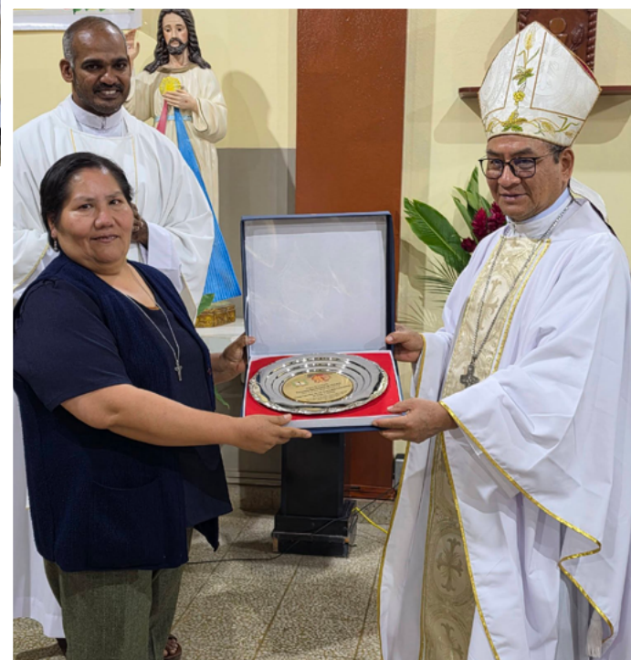
Fotos de la misa de acción de gracias por la presencia de la Congregación en Laderas de Chillón