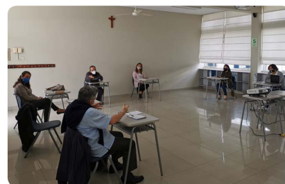
Consejo Directivo Colegio SS.CC. Recoleta