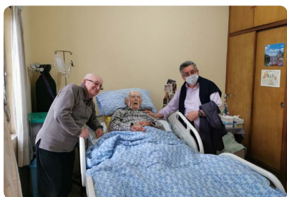
Comunidad de Monterrico