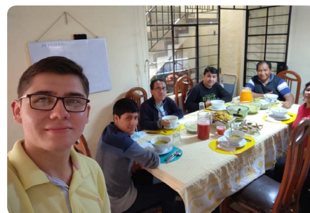
Comunidad de Montenegro