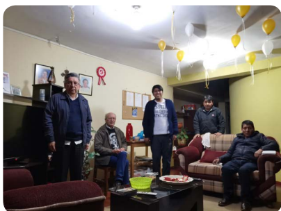
Comunidad de Huaripampa