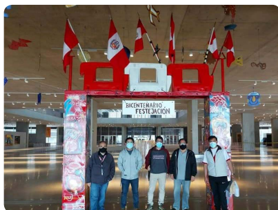
Comunidad de Wilson