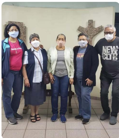
Comunidad Nuestra Señora Aparecida Brasil