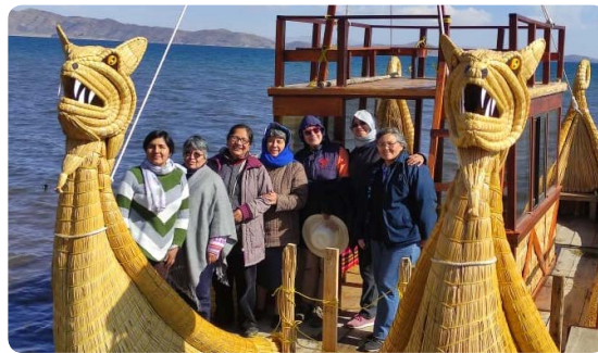
Comunidad Betania Bolivia