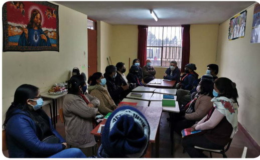
Consejo Pastoral Parroquia San Miguel Arcangel Huaripampa