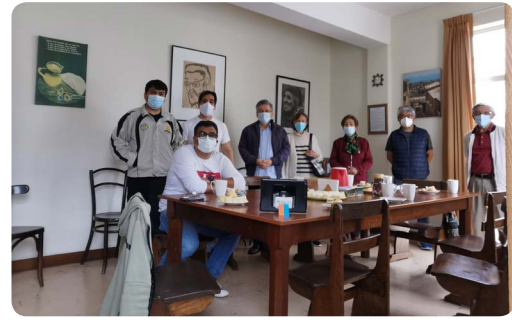
Rama Secular SS.CC.