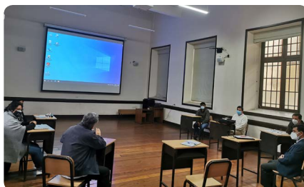
Comisión Económica Colegio SS.CC. Recoleta